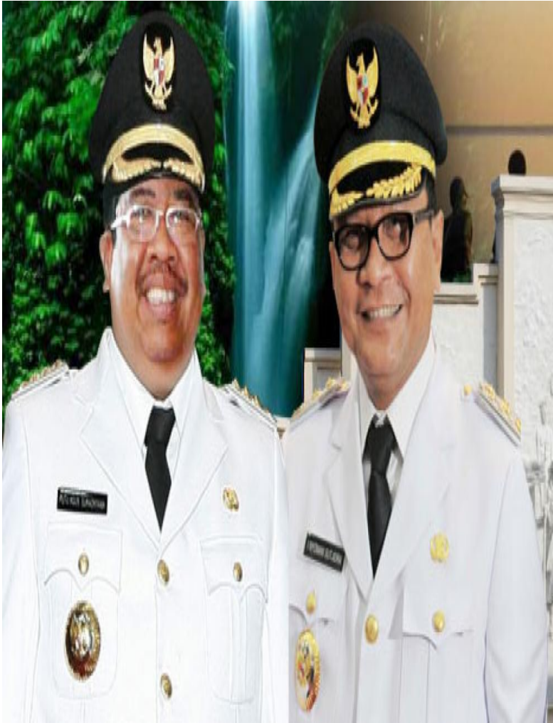
BUPATI BULELENG PUTU AGUS SURADNYANA, ST